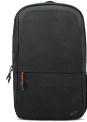
Lenovo Business Casual 43,2 cm (17") Rucksack Artikelnr.: 4X41C12468