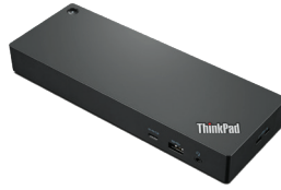
Lenovo ThinkPad Universal Thunderbolt™ 4-Dock Artikelnr.: 40B00135xx